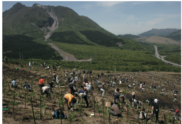
九州ふるさとの森づくり (大分県由布市)