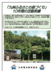
10年間の活動実績をとりまとめたパンフレット

パンフレットは九州電力ホームページ 関連・詳細情報 (P13参照) 創立50周年記念 「九州ふるさとの森づくり」10年間の活動実績