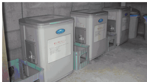
生ごみ処理機設置状況