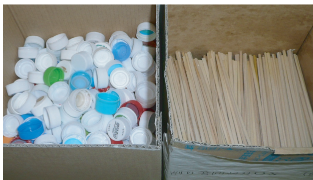
ペットボトル蓋・割り箸回収箱

また、生ごみについては、生ごみ処理機で堆肥化し構内緑化用の肥料として利用しています。