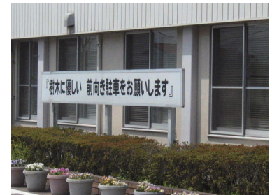
「前向き駐車」呼びかけ看板