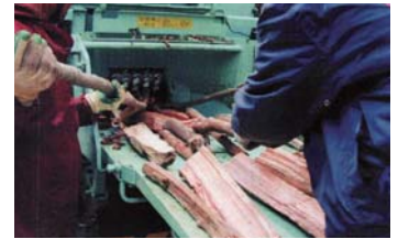
破砕機による粉砕