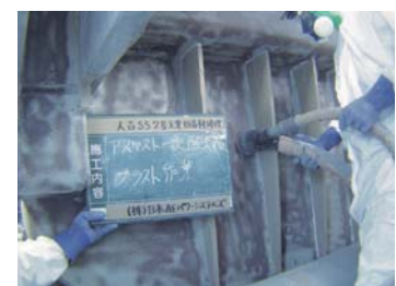
石綿除去作業状況