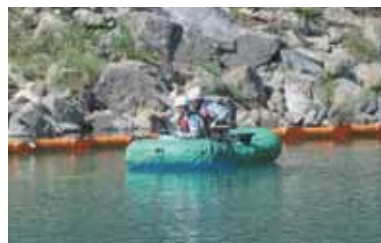
オイルフェンス設置及び油回収

水力発電所は河川に油が流出しない設備の構築を行っていますが、万が一油が流出した場合に備え、迅速・的確な対応により、被害を最小限に抑えることが出来るように年1回定期的な訓練を行っています。