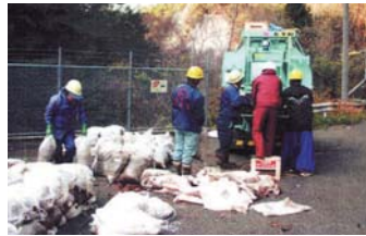
流木塵芥の袋詰め