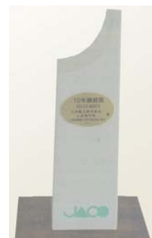
株式会社日本環境認証機構より受領した「10年継続賞」 (2011年3月)

当電力所は、環境管理システムの国際規格であるISO14001の認証を取得し、2012年3月で11年間の継続となりました。