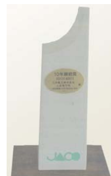
株式会社日本環境認証機構より受領した「10年継続賞」 (2011年3月)

当電力所は、環境管理システムの国際規格であるISO14001の認証を取得し、2012年3月で11年間の継続となりました。