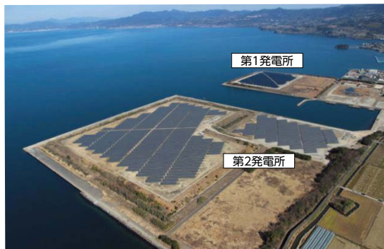
大村メガソーラー発電所

今後も、地球環境にやさしい再生可能エネルギーの推進に寄与していきたいと考えます。