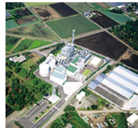
みやざきバイオマスリサイクル(株) みやざきバイオマスリサイクル発電所