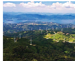
長島ウインドヒル(株)長島風力発電所