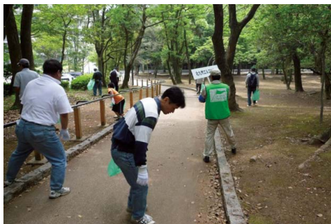
よみや 夜宮公園での清掃活動 (北九州エル・エヌ・ジー(株))

2012年度は、これらの環境活動が認められ、(株)ジェイ・リライツに、国土交通省九州地方整備局から、道路美化活動に対する感謝状が授与されました。