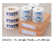
回収した古紙で作った製品

古紙のリサイクルについては、取組みを開始した2002年度以降、100%リサイクルを継続しており、回収した古紙の一部は、グループ会社の九州環境マネジメント(株)で、コピー用紙、紙ひも、トイレトペーパーに再生されています。