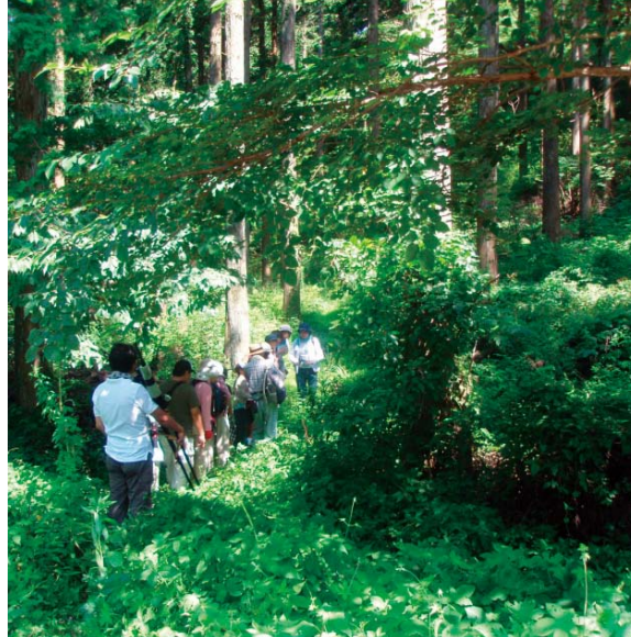
山下池周辺の社有林での自然観察会の様子

WEB 詳細は九州電力ホームページ 関連・詳細情報 (P2参照) > 環境教育支援活動