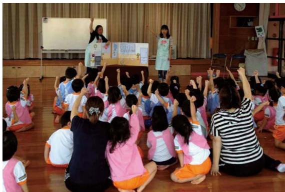
あけぼの保育園（福岡県福岡市）

2003年度から開始したこの活動は、2013年度までに2,600回以上実施し、およそ18万名のお子さまや保護者の皆さまにご参加いただきました。