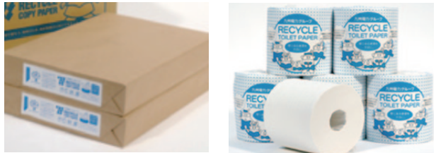
回収した古紙で作った製品

古紙のリサイクルについては、取組みを開始した2002年度以降、100%リサイクルを継続しており、回収した古紙の一部は、グループ会社でコピー用紙やトイレトーパーなどに再生されています。