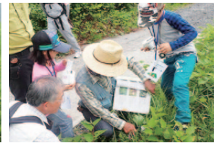
自然観察会の様子