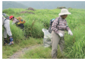
外来種(植物)駆除の様子

また、作業終了後には、活動に参加した子どもたちを対象に自然観察会を開催しました。