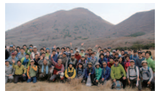
作業後の集合写真

2016年5月末に平治岳に登った時には、ミヤマキリシマがとても綺麗に咲き誇っていました。ボランティアの成果の表れだと思えば、とても嬉しかったです。これからもぜひこの活動に参加したいと思います。