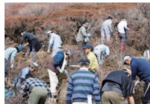
ミヤマキリシマ保護活動の様子

2015年度は、11月12日に実施し、当社社員やOBを含む94名のボランティアの方々に参加いただきました。