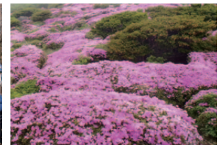
平治岳に咲くミヤマキリシマ(6月頃)