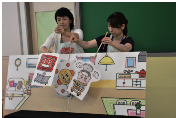
エコ・マザー活動の様子

なお、これまでの13年間で、計3,100回以上実施し、約22万名の皆さまにご参加いただいています。