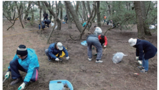
虹の松原再生・保全活動 ニシム電子工業(株)

今後も、日本三大松原の1つでもある虹の松原の「白砂青松」を守る、この再生・保全活動に参加していきたいと思えます。