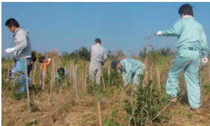
「響灘・鳥がさえずる 緑の回廊」 (福岡県北九州市)

2015年度についても、「響灘・鳥がさえずる緑の回廊」(福岡県北九州市)や「九電の森ひとよし」(熊本県人吉市)、「森と海の再生交流事業植樹祭」(福岡県早良区)など5か所で植樹・育林活動が実施され、グループ会社からも44名が参加しました。