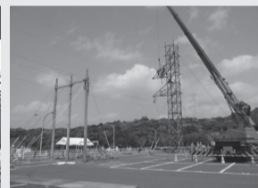
仮鉄柱組立・据付

海水を利用した常設の冷却設備が使えなくなった場合においても、 以上の対策を実施したことにより、原子炉や使用済燃料貯蔵プールを継続的に冷却することが可能になりました。