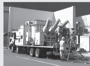
車載型移動用変圧器の接続