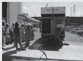
高圧発電機車の繋ぎ込み