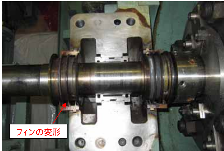
軸受の油切りの変形状況