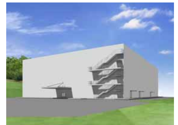
免震重要棟の設置例