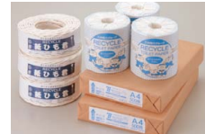
回収した古紙で作った製品

古紙のリサイクルについては、取組みを開始した2002年度以降、100%リサイクルを継続しており、回収した古紙の一部は、グループ会社の九州環境マネジメント(株)で、コピー用紙、紙ひも、トイレトーパーに再生されています。