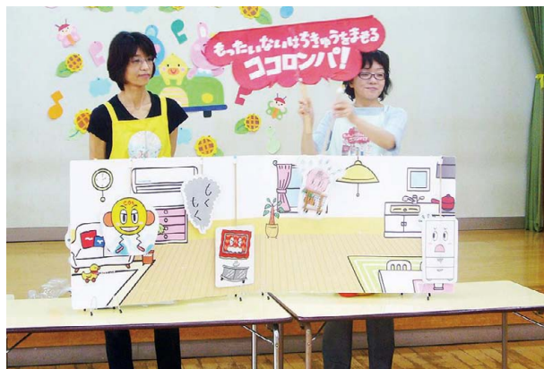
エコ・マザー活動の様子

WEB 詳細は九州電力ホームページ 関連・詳細情報 (P2参照) > エコ・マザー活動