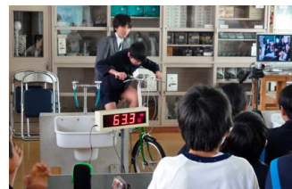
自転車発電機を使った授業の様子

今後も、分かりやすい授業になるよう創意工夫し、エネルギーに興味や関心をもってもらえるよう努めていきたいと思っています。