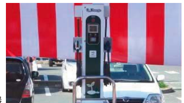
電気自動車用急速充電器