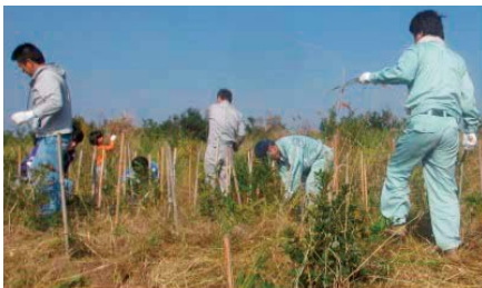
「響灘・鳥がさえずる 緑の回廊」 (福岡県北九州市)

2014年度の「九州ふるさとの森づくり」では、当社社員・家族約650名、グループ会社社員・家族約1,000名を含む約3,600名の皆さまのご協力により、「響灘・鳥がさえずる緑の回廊」(福岡県北九州市)、「古賀市ふるさとの森づくり」(福岡県古賀市)など9か所でボランティアによる育林・植樹活動を実施しました。